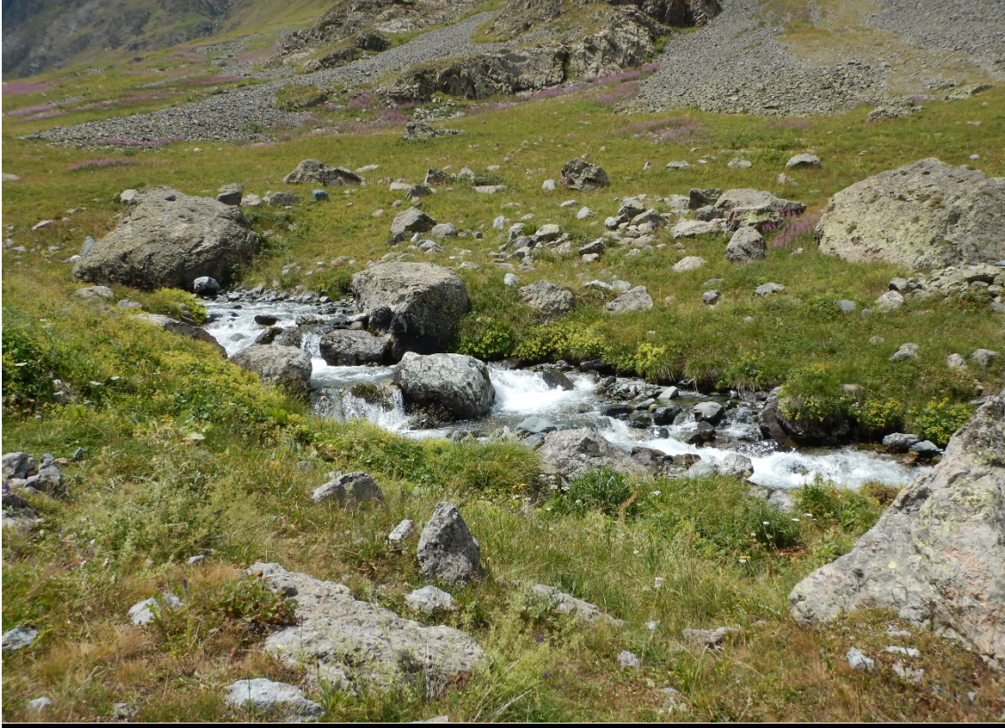
Olgunlar'dan Dilberdüzü'ne Heveg Vadisi boyunca akan Heveg deresi

vadi içerisinde sağımızda akan Heveg Deresi boyunca sürdü. Yürüyüşte Dilberdüzü'nden önce Nastaf yaylasına varıyorsunuz.(2375mt) Nastaftan sonra küçük bir kayalık geçmeniz gerekiyor. Yolda son çeşme Nastafta bulunuyor. Nastafta yaklaşık 30 civarında taş ev var ama kullanılmıyor durumdadır. Buradan sonra yol eğim kazanıyor ve Dilberdüzü'ne yaklaştıkça eğim artıyor.